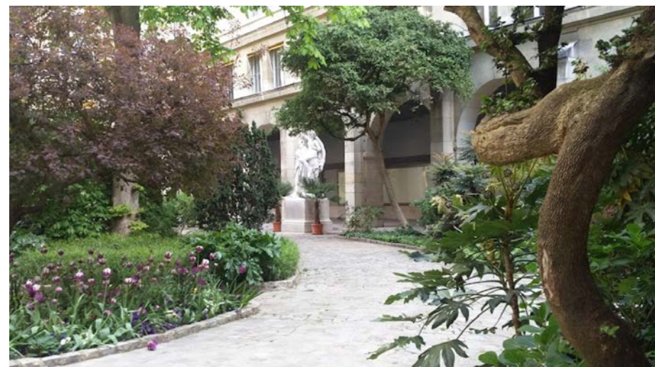
Cloître des Cordeliers

La faculté des Sciences et Ingénierie de Sorbonne Université couvre un large spectre disciplinaire, réparti en six unités de formation et de recherche (UFR) : chimie, ingénierie, mathématiques, physique, sciences de la vie, ainsi que Terre, environnement et biodiversité et 3 stations marines.